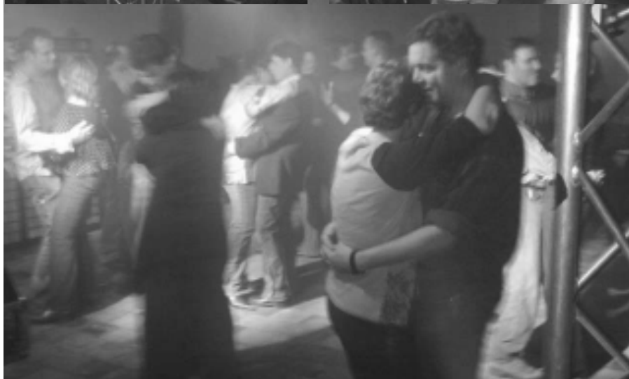
Het Swingfeest op 21 november was een enorm succes, volgend jaar mogen we weer!