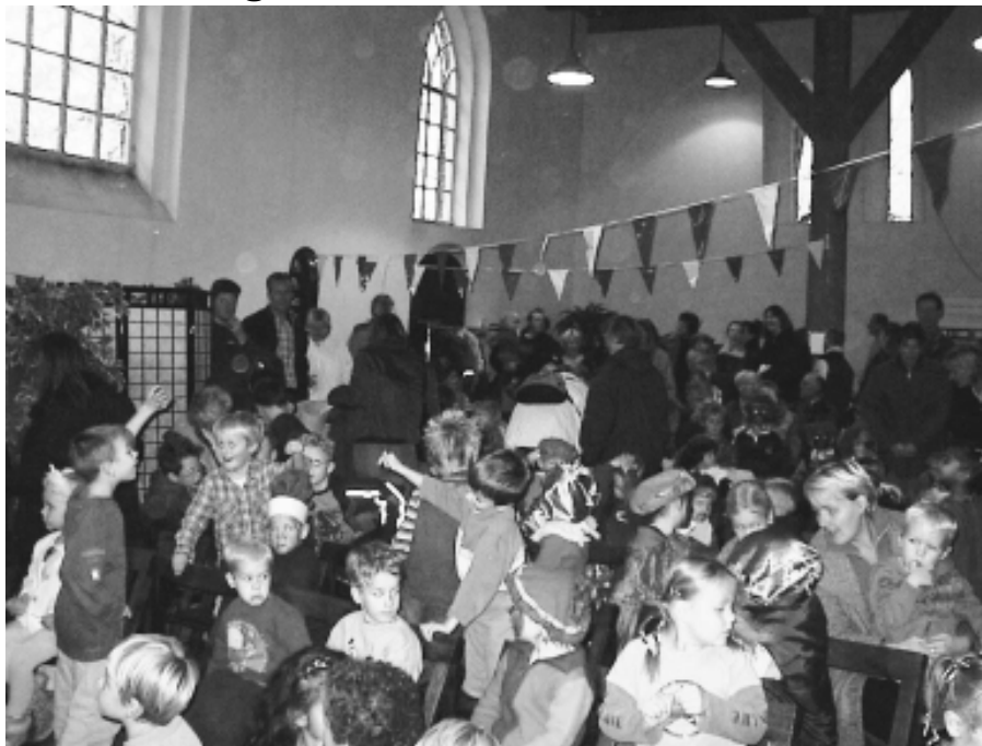
De kinderen van Gravenburg genieten op het Pietenfeest.